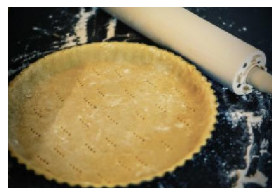
La pâte feuilletée