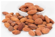
Les amandes (f)