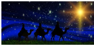
Les rois mages