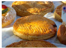
La galette des rois à la frangipane